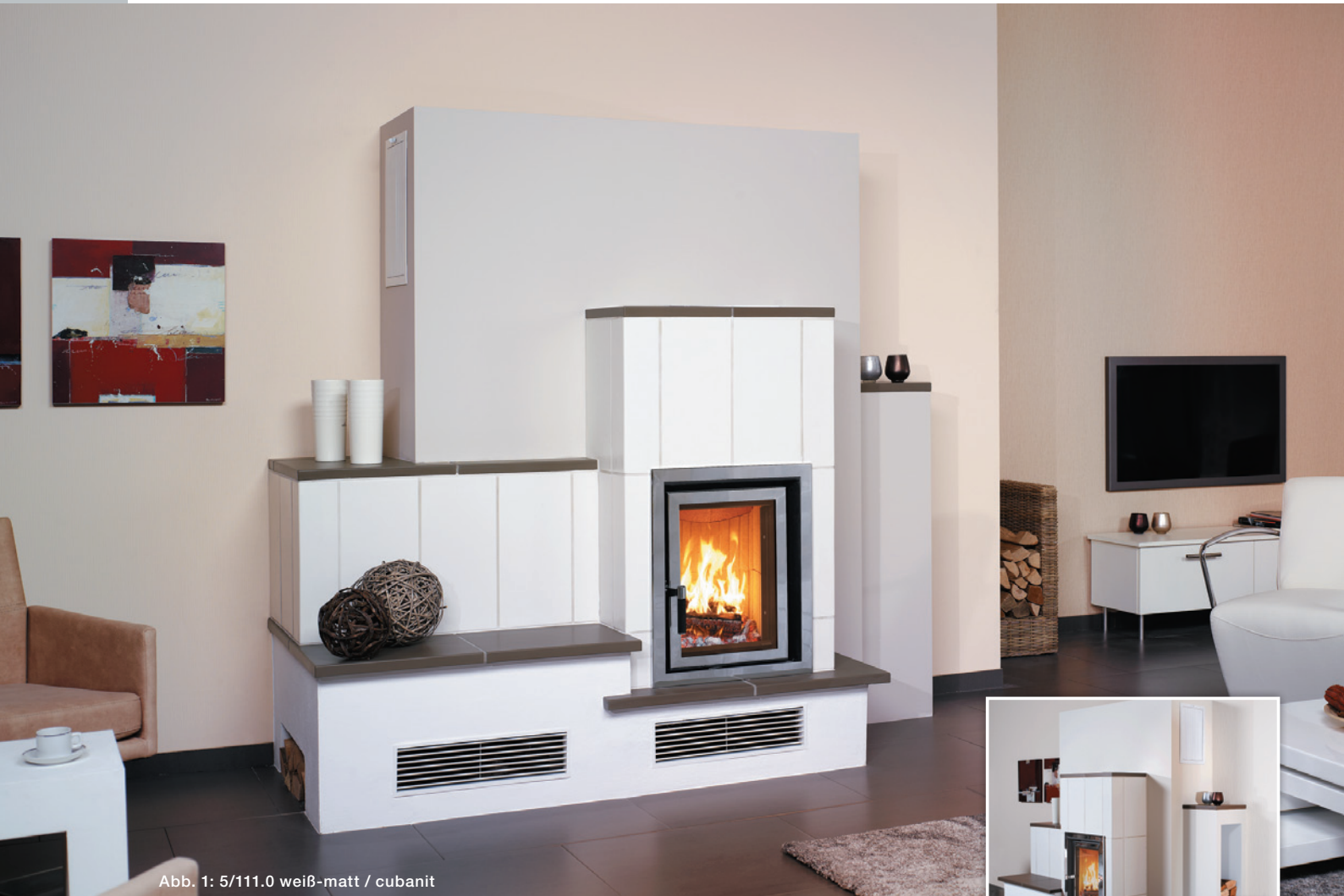
Abb. 1: 5/111.0 weiß-matt / cubanit

GmbH & Co. KG HARK ® Die 1 Nr. 1 im Kamin- und Kachelofenbau