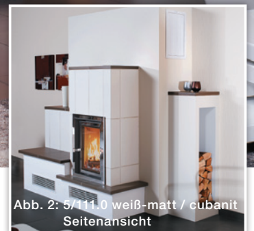
Abb. 2: 5/111.0 weiß-matt / cubanit Seitenansicht