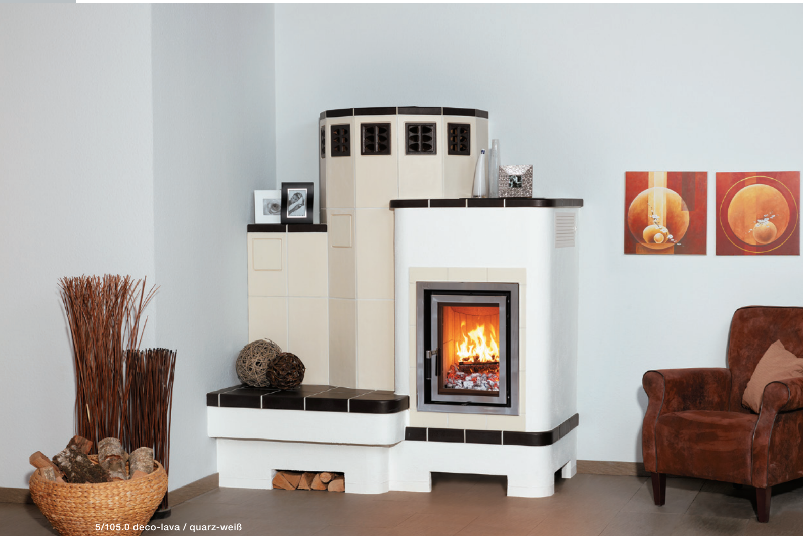
5/105.0 deco-lava / quarz-weiß

GmbH & Co. KG HARK ® Die 1 Nr. 1 im Kamin- und Kachelofenbau